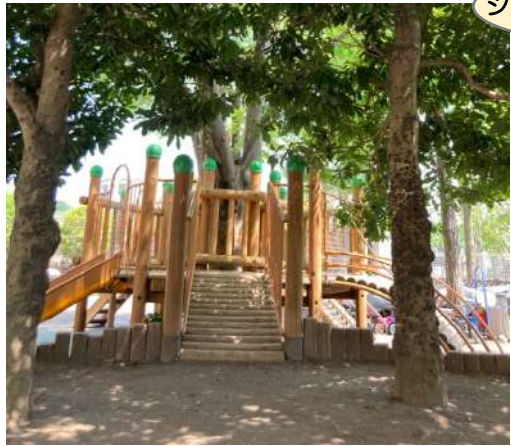
ジャングラミンはママと一緒にね