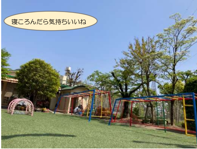
寝ころんだら気持ちいいね