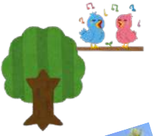
藤棚の下でおままごと