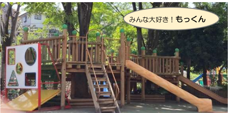
みんな大好き！もっくん